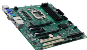
△ Side view