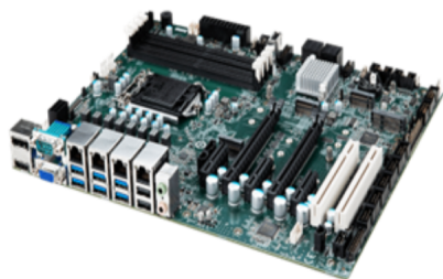
▲ Side view