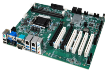
▲ Side view