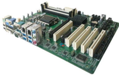
▲ Side view